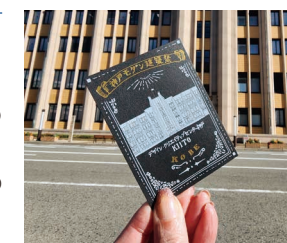
モチーフとなった建築と記念撮影 (※2024年カードデザイン)