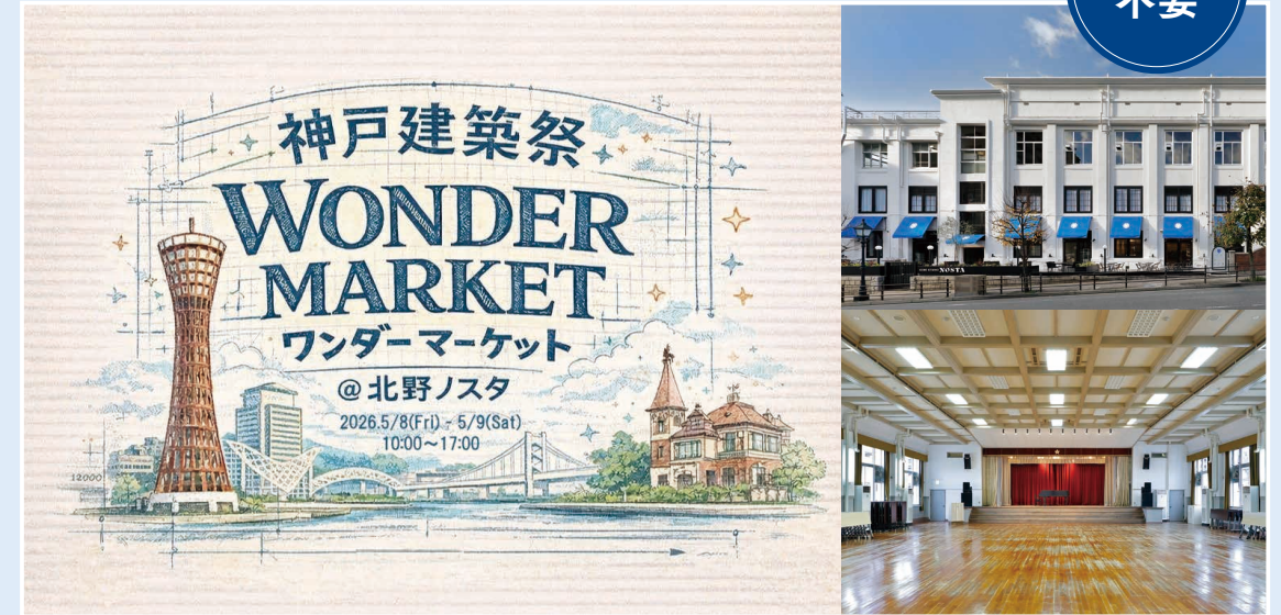
神戸北野ノスタ3階 ステラホール

参加費 | 入場無料(パスポート不要) 開催日時 | 5/8(金) 10:00-17:00 5/9(土) 10:00-17:00 場所 | 神戸市中央区中山手通 3-17-1 アクセス | 各線三宮・元町駅より 徒歩約12分